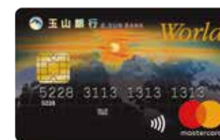
玉山世界卡 用愛心啟動「黃金種子計畫」

*結合世界卡單筆及定期定額捐款，讓更多偏遠小學的孩子們，都能擁有閱讀的幸福。 *核卡後，您的每一筆國內消費，玉山銀行將提撥固定比例，為台灣教育盡心力。 *玉山世界卡提撥千分之三/玉山南山世界卡提撥千分之二 *玉山黃金種子計畫核准字號：衛部數字第1081370708號。 *詳細內容請洽全國分行，本行保留申請核准與否及相關活動變更之權利。