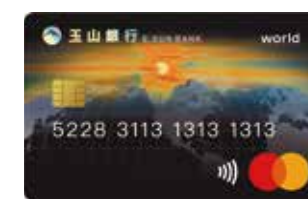
玉山世界卡 用愛心啟動「黃金種子計畫」

*結合世界卡單筆及定期定額捐款，讓更多偏遠小學的孩子們，都能擁有閱讀的幸福。 *核卡後，您的每一筆國內消費，玉山銀行將提撥固定比例，為台灣教育盡心力。 (玉山世界卡提撥千分之三/玉山南山世界卡提撥千分之二) *玉山黃金種子計畫核准字號：衛部數字第1091364806號。 *詳細內容請洽全國分行，本行保留申請核准與否及相關活動變更之權利。