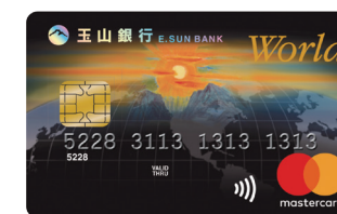
玉山世界卡 用愛心啟動「黃金種子計畫」

*結合世界卡單筆及定期定額捐款，讓更多偏遠小學的孩子們，都能擁有閱讀的幸福。 *核卡後，您的每一筆國內消費，玉山銀行將提撥固定比例，為台灣教育盡心力。 (玉山世界卡提撥千分之三/玉山南山世界卡提撥千分之二) *玉山黃金種子計畫核准字號：衛部教字第1071364758號。 *詳細內容請洽全國分行，本行保留申請核准與否及相關活動變更之權利。